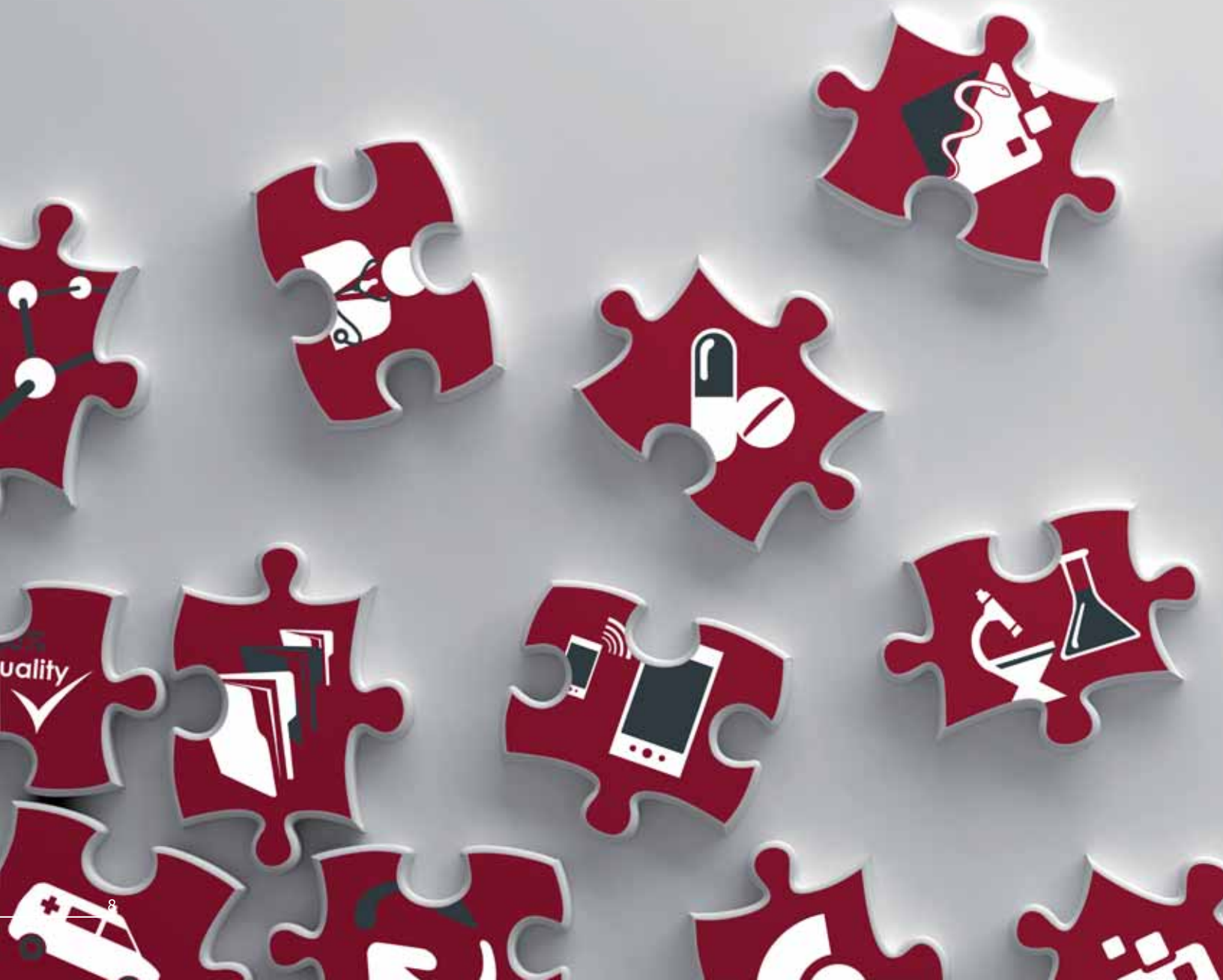
Abbildung von Selektivverträgen ver- schiedenster Anbieter wie HÄVG, gevko, ...